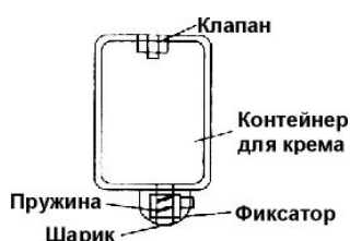
Рис.2. Контейнер для крема