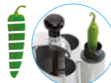
Толкатель Exactitube Ø 39 мм

R 502 Воронки для фруктов и овощей любых размеров