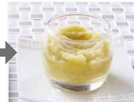
Пюре из свежих яблок гренни смит