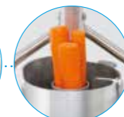
Цилиндрическая воронка Ø 58 мм