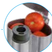
Большая воронка Крупные овощи

R 752 Воронки для фруктов и овощей любых размеров