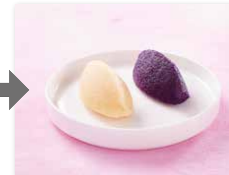
Дуэт из свежей краснокочанной капусты и сельдерея