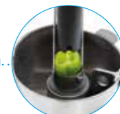
Толкатель Exactitube Ø 39 мм