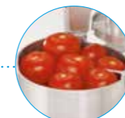
Широкая воронка XL Крупные овощи

R 752 Воронки для фруктов и овощей любых размеров