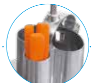
Цилиндрическая воронка Ø 58 мм