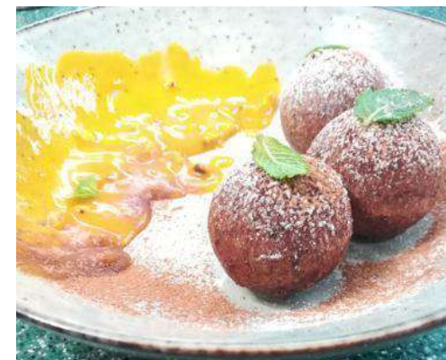
кваркини с фруктовым муссом и сиропом