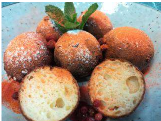
кваркини в сахарной пудре