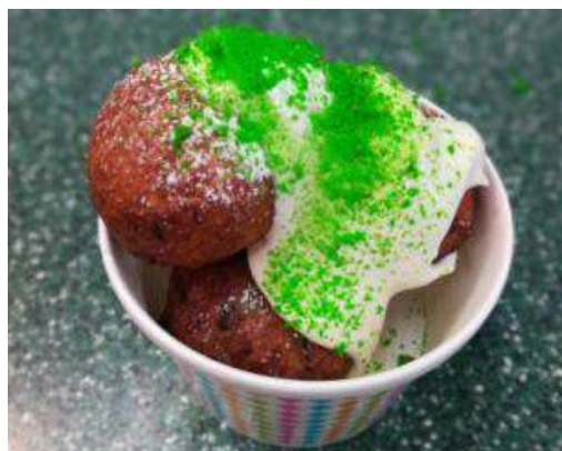
кваркини с наполнителем