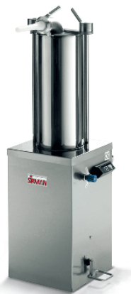
Sirman Шприцы колбасные , model IS 15 Idra :

Sirman Spa Viale dell'Industria 9/11 35010 PIEVE DI CURTAROLO (PD), Italy Tel./Fax. +39 049 9698666 / +39 049 9698688 email: info@sirman.com