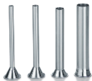
Funnels in s/s ø 13-16-20-38 optionals