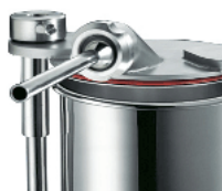
Optional s/s bush, optional