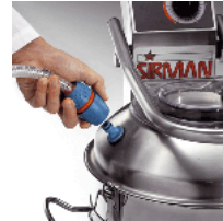
Fast connection/remove of water entry