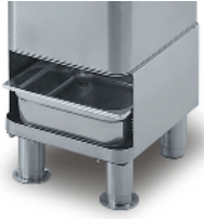
Optional trestle with sieve