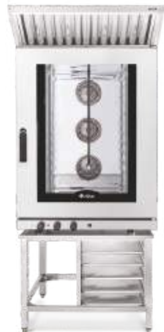
КЭП-10 на ПК-10-6/4