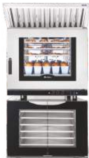
КЭП-6П на ШРТ-12