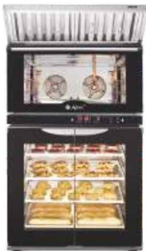
КЭП-4П на ШРТ-8