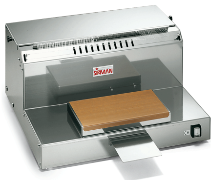
Sirman Горячие столы , model Dispenser 50 M2 :

Sirman Spa Viale dell'Industria 9/11 35010 PIEVE DI CURTAROLO (PD), Italy Tel./Fax. +39 049 9698666 / +39 049 9698688 email: info@sirman.com