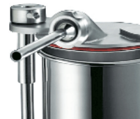
Bush in stainless steel, optional