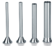
Funnels s/s ø 13-16-20-38 optional