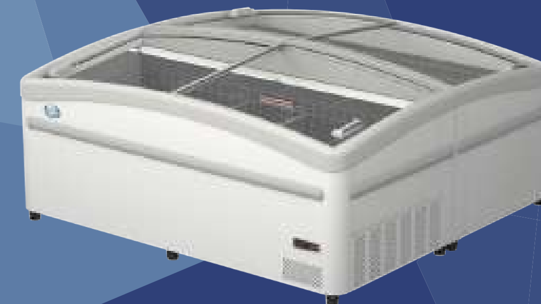
ARTICA Торцевой элемент (Testata) спина к спине