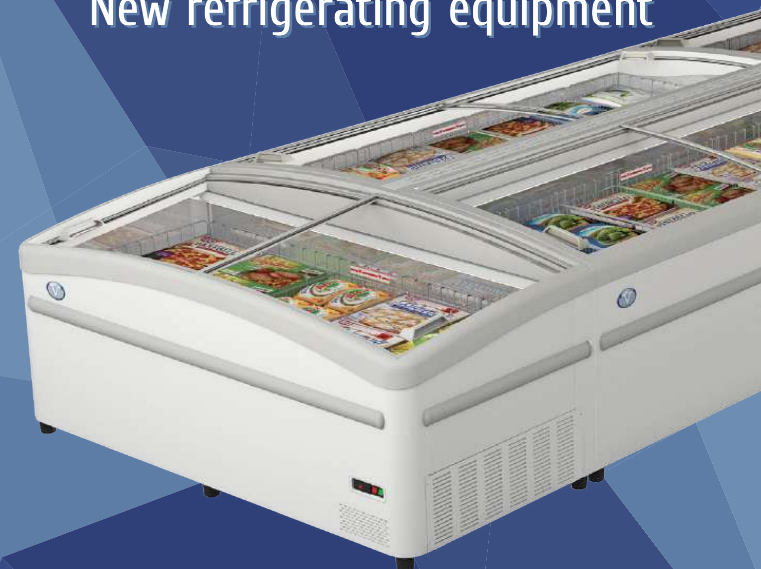
ARTICA Ларь-бонета Chest freezer

По вопросам приобретения и дистрибьюции / Concerning acquisition and distribution