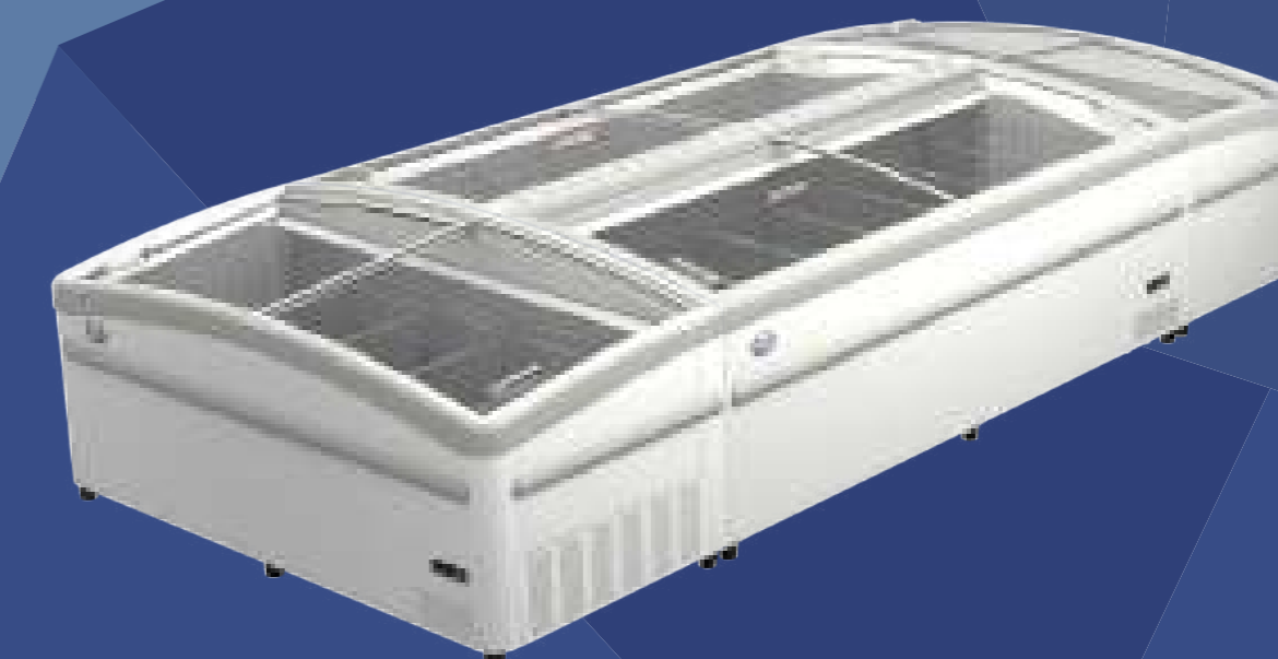
ARTICA Остров Island