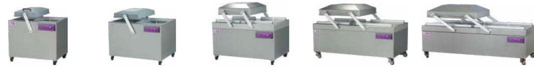
Storm Cyclon Bayamo Typhoon Hurricane

Эти машины могут достичь вакуум 99,99% (0,1 mbar), предназначены для различных производственных секторов, где необходимо увеличить производительность процесса упаковки, что достигается за счет двойной камеры, рационального дизайна и простоте в управлении. Выбор двухкамерных вакуумных упаковщиков даст вам неоценимое конкурентное преимущество.