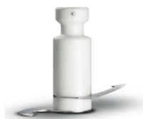
Shaft with knives to mix dough